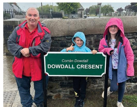
Nowy znak przy wejściu do osiedla