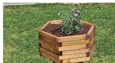
Letnie kwiaty w donicach