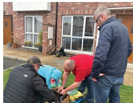
Ciężka praca przy sadzeniu cebulek

Jeśli zainspirowało Cię to i chciałbyś uzyskać pomoc w ramach własnego programu, skontaktuj się z Biurem Wsparcia pod numerem 01 820 0002 i poproś o swojego specjalistę ds. mieszkalnictwa lub wyślij e-mail na adres supportdesk@neha.ie .